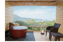
露天風呂付き客室