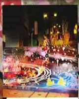
伊香保アート階段