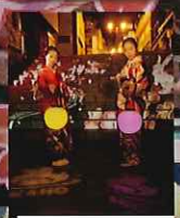
NAKED ディスタンス提灯*