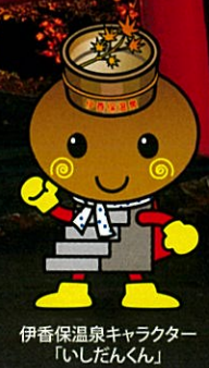
伊香保温泉キャラクター「いしだんくん」

実施期間：10月22日（火）～11月17日（日）予定 点灯時間：16：30～22：30 予定