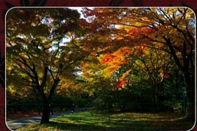
伊香保温泉天風呂、県立伊香保森林公園周辺なども紅葉の名所です。

日本の名湯、伊香保温泉。 その湯元「河鹿橋」付近には榛名山系の豊かな自然に育まれた、もみじ、かえで、くぬぎ、うるしなどが自生しています。これらの樹々の紅葉は、毎年10月下旬から一斉に色づき始め、11月上旬にはピークを迎えます。ライトアップに浮かび上がる、幽玄な夜の紅葉をお楽しみください。