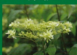
八重咲きアナベル(ハイエスターバスト)