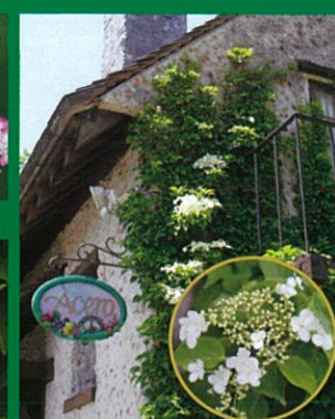
「ツルアジサイ」(見頃:5月下旬)