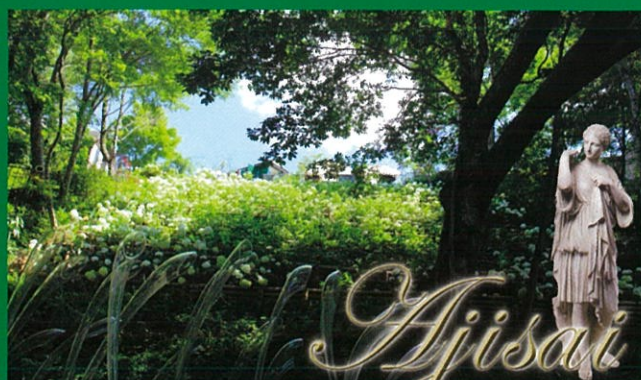
「あじさいの滝」(見頃:7月下旬より)