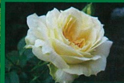
マリーアントワネット