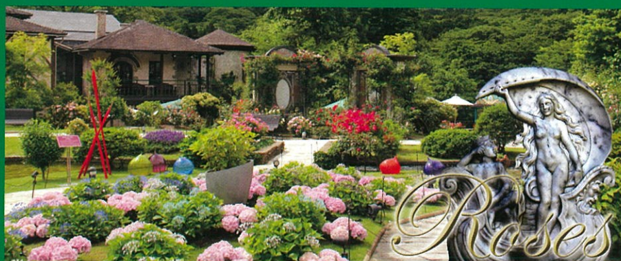
クリスタルガラス・オルテンシアとバラの競演 (写真:2017年6月上旬 庭園の様子)