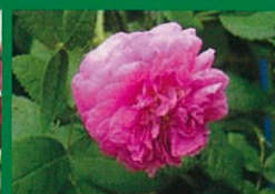
エンブレンスジョセフィーヌ