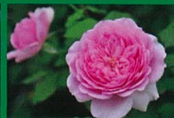
ローズボンバドール