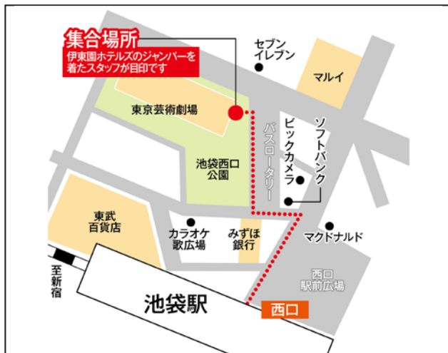
東京芸術劇場前/JR池袋駅西口より徒歩5分